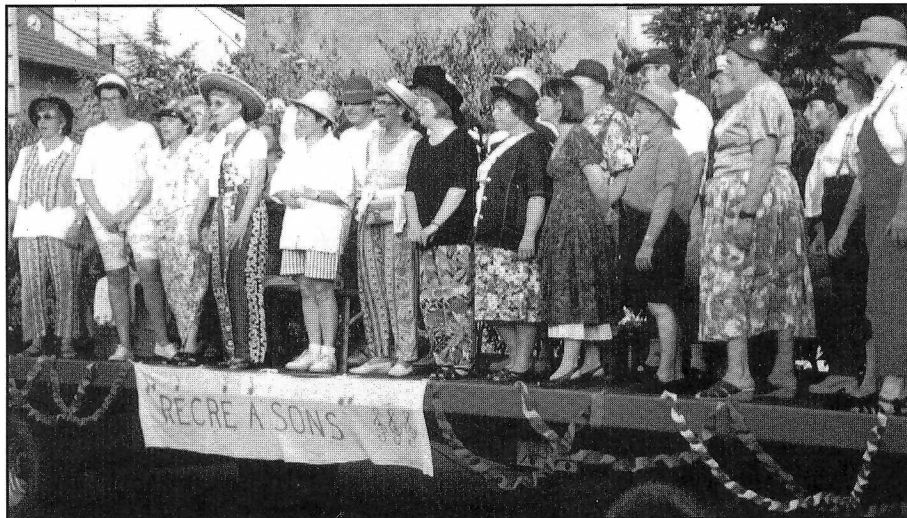
La fête de la musique, le 21 juin 1995

Vous avez envie de partager cette joie et cette magie du chant ? On vous attend, sans bizutage et avec le sourire.