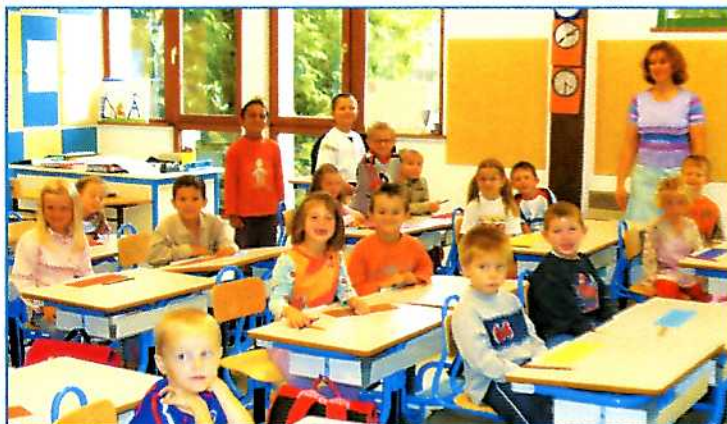
Un mobilier neuf