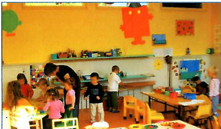
Une classe repeinte

L'école maternelle a, elle aussi, fait peau neuve. Le hall d'entrée, la salle de classe et la salle de repos ont repris des couleurs. Des couleurs gaies, claires adaptées aux lieux ont été choisies par le personnel enseignant et mises en œuvre par l'Entreprise Majcen de Saint-Avold..