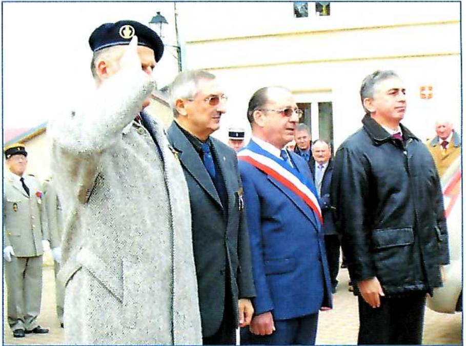
Les autorités pendant la minute de silence

Un vin d'honneur a rassemblé les participants au Foyer.