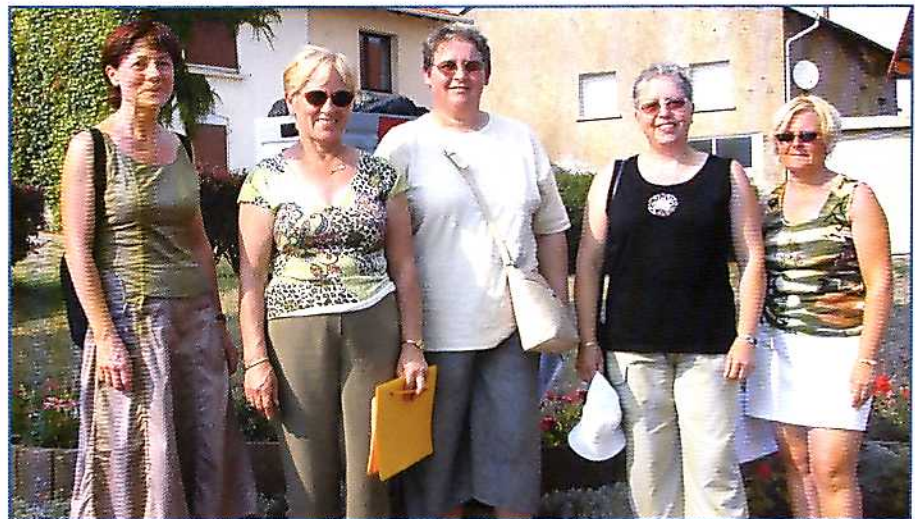
Les 4 membres du jury accompagnés par Mme Bischoff conseillère municipale qui les a guidés dans le village