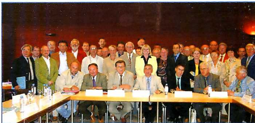
Le Conseil de la Communauté des Communes du pays Naborien

Le Maire, les adjoints et les conseillers vous invitent à la cérémonie des voeux du maire