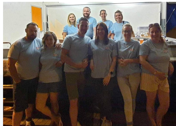
Participation à l'action solidaire d'octobre rose à Lachambre en reversant une partie des bénéfices à La Ligue Contre le Cancer

Le bureau compte 8 membres et se réunit une fois par mois pour planifier et organiser les différentes actions de l'année.