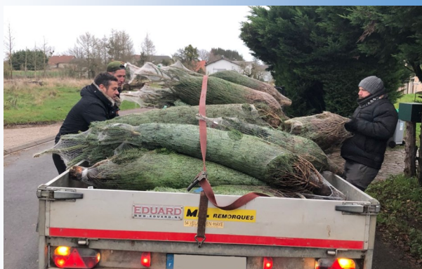
Livraison des sapins de Noël le 10 décembre

L'APE c'est aussi proposer l'achat des fournitures de rentrée via un partenaire spécialisé ou encore régaler les participants après le spectacle de la St Martin le 10 novembre avec un curry wurst !