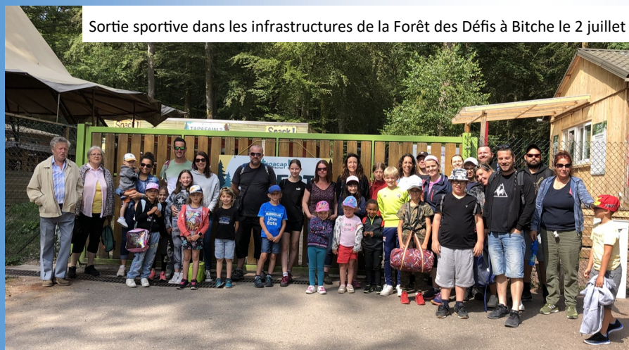
Sortie sportive dans les infrastructures de la Forêt des Défis à Bitche le 2 juillet