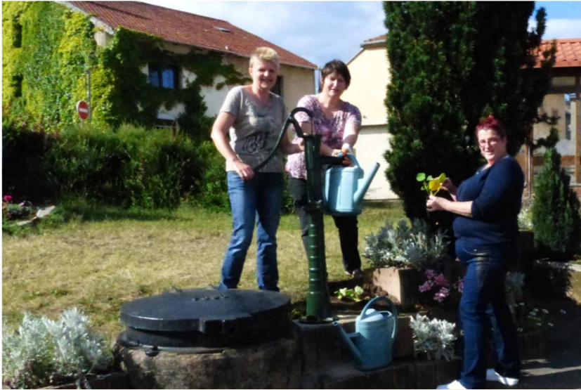
Mise en place d'une pompe à eau traditionnelle servant à l'arrosage des espaces fleuris communaux et à la décoration.