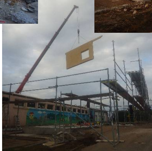
Une grue avec une flèche de 30 m située de l'autre côté du bâtiment commandée par radio et qui a rendu le montage très spectaculaire.