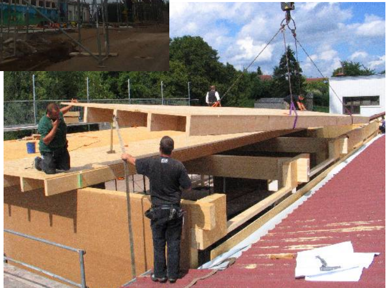
Assemblage des éléments du toit