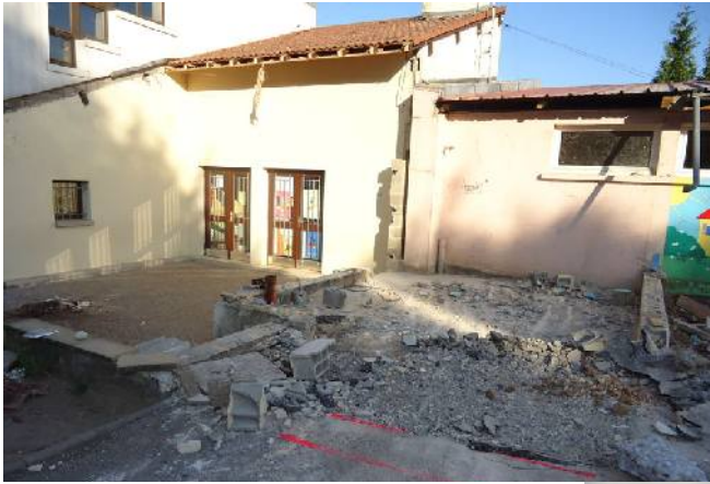
Démolition du préau et du local de rangement