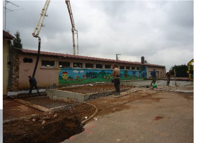
Réalisation des fondations