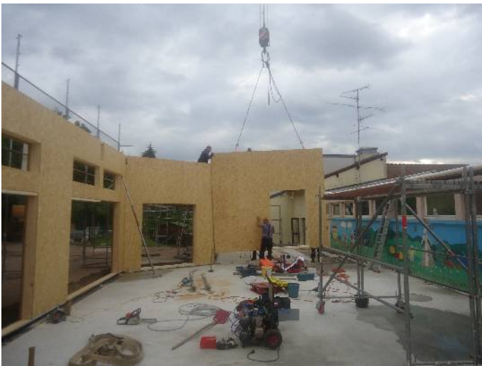
En fin de journée le bâtiment était assemblé