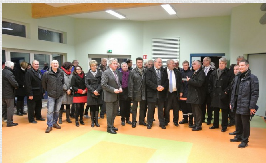
La salle d'éveil de l'école