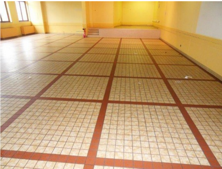
La salle avant rénovation

Subvention parlementaire de Madame La Députée Paola Zanetti : 5 000 €