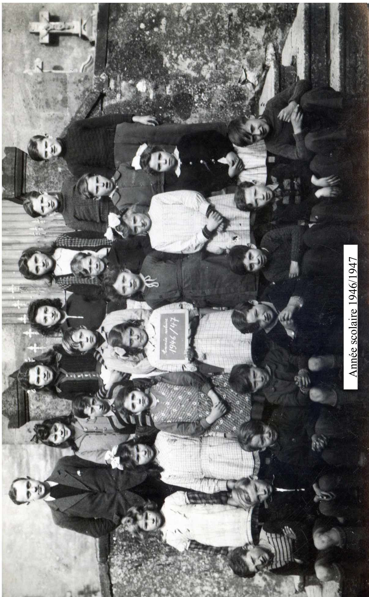
Année scolaire 1946/1947